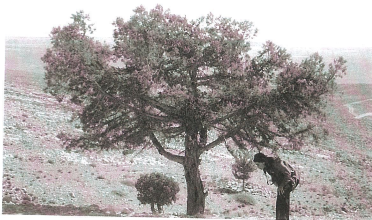
Bild Sliman Manour: Virtuelle Galerie der Birzeit Universität – virtualgallery.birzeit.edu

WEST BEIRUT Regie: Ziad Doueiri. Libanon/Frankreich/Belgien/Norwegen 1998, 105 min, Arabisch mit deutschen Untertiteln. Verleih D: Kairos Film; Verleih CH & DVD: www.trigon-film.org